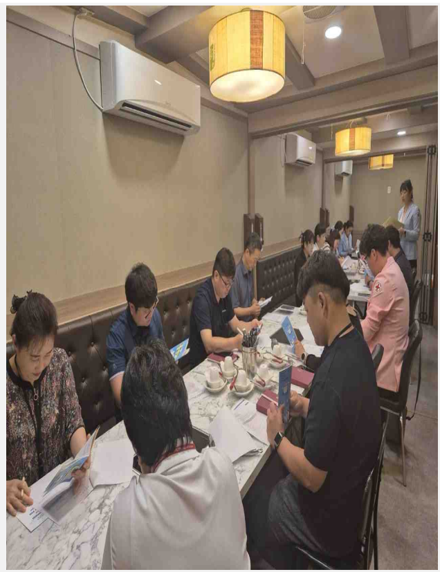
사진설명: 상주적십자병원-상주시종합사회복지관 간담회