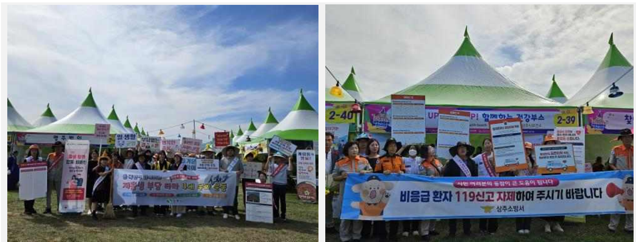
사진설명: 상주세계모자페스티벌 현장에서 상주시 유관기관과 합동 캠페인 실시