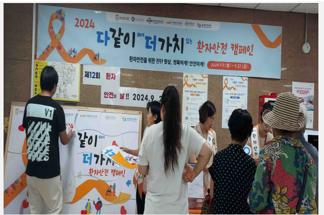
[사진 설명] 환자안전문화 조성 홍보부스 운영