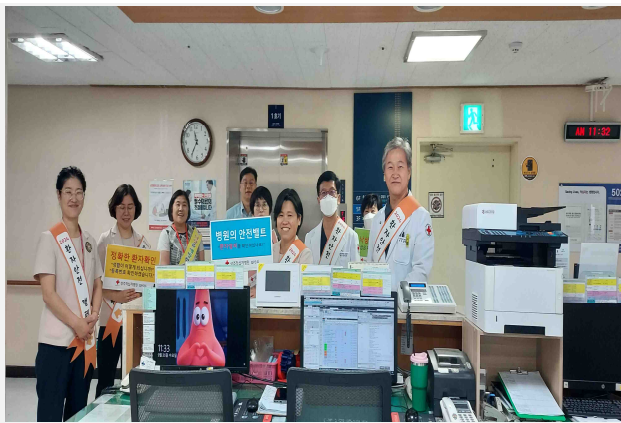
[사진 설명] 경영진 라운딩

- 중앙환자안전센터의 '2024년 “다같이 해서 더 가치 있는” 환자안전 캠페인’ 기관 선정 -