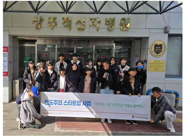
[사진설명] 예방접종 종료 후 기념촬영