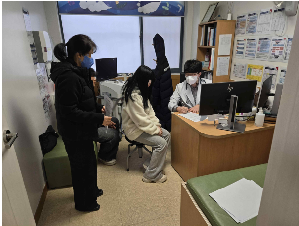
[사진설명] 소아청소년과장 예방접종 전 문진