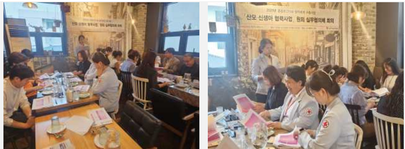
사진설명: 산모·신생아 협력사업 원외실무협의체 회의 참석 모습