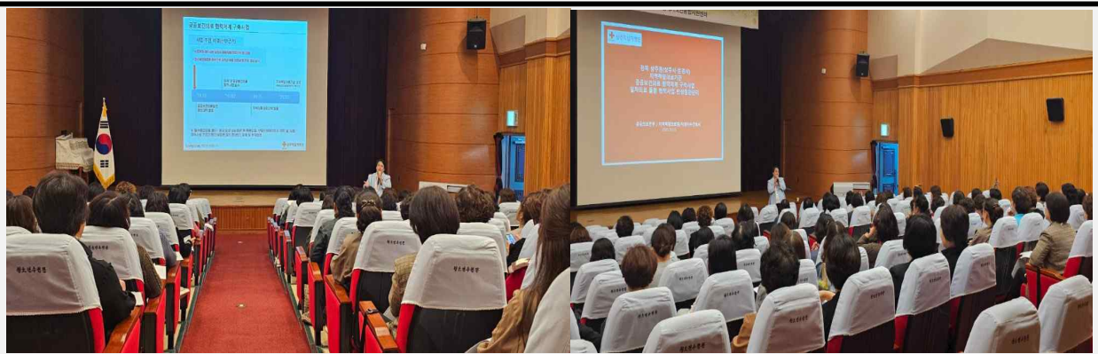
[사진설명] 회의 모습

-상주시 돌봄 종사자 70명 대상 교육, 만성질환 관리 실천 방안 공유 -