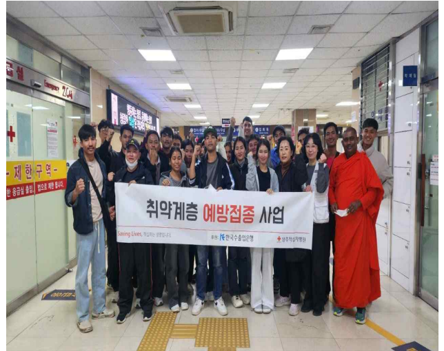
[사진설명] 2025년 외국인근로자 예방접종후 단체 사진