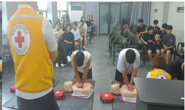
사진설명: 인체순환기능 원리 학습