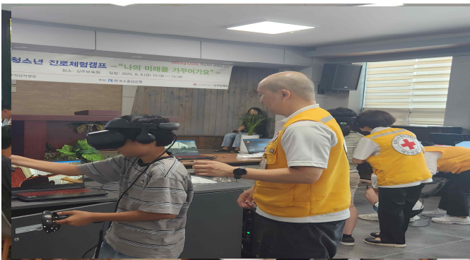
사진설명: 가상체험 재난극복활동

- 함께 했던 추억을 되새기고, 새로운 꿈을 품고 건강한 성장을 약속하는 시간 보내 -