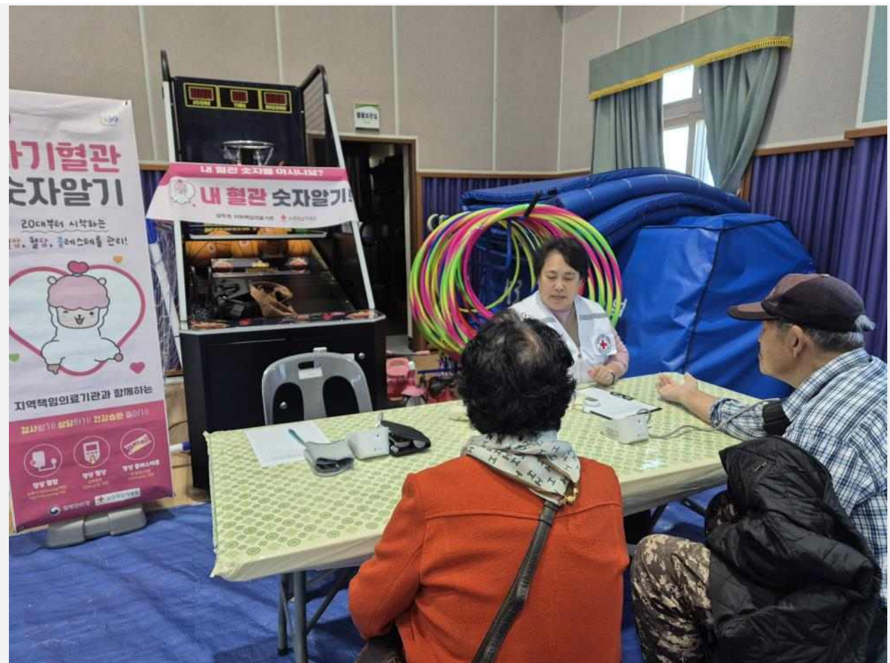
[사진설명] 캠페인 모습