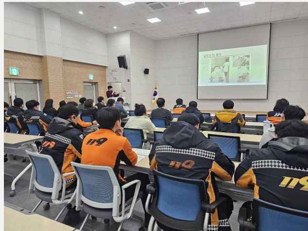
사진설명: 심전도 교육을 받고 있는 모습