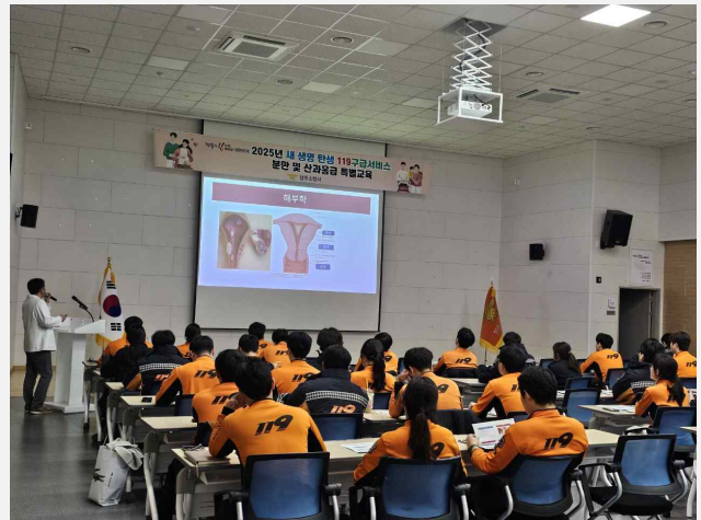
사진설명: 응급분만 및 신생아 응급처치 교육을 받고 있는 모습