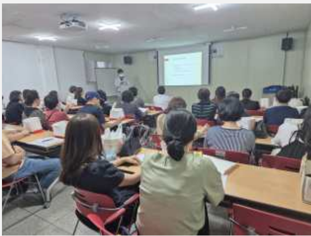
사진설명: '고위험 신생아 응급상황 사정 및 처치' 특강