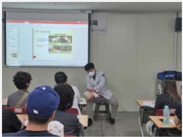
사진설명: 영아 하임리히법 강의