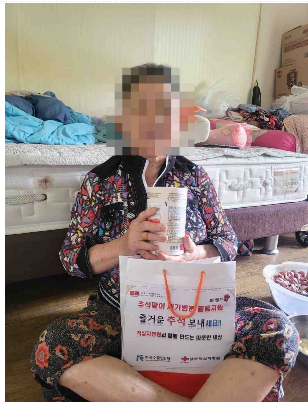
[사진설명] 모동면 어르신께 유산균 전달