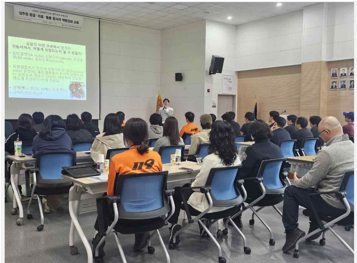
사진설명: 3월 30일 119구급대원 및 보건의료 관계자를 대상으로 부정맥 중심 심전도 교육이 진행되고 있다.