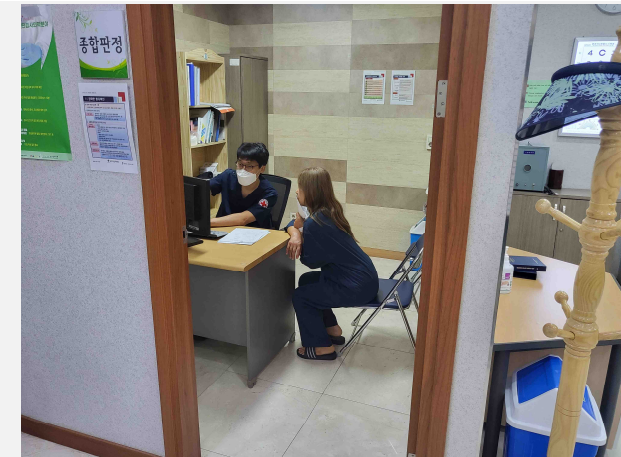
사진설명: 종합건강검진 후 가정의학과과장 상담