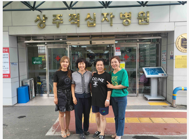
사진설명: 종합건강검진 후 기념촬영